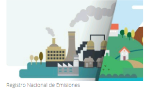
Registro Nacional de Emisiones

para el reporte de emisiones de compuestos y gases de efecto invernadero.